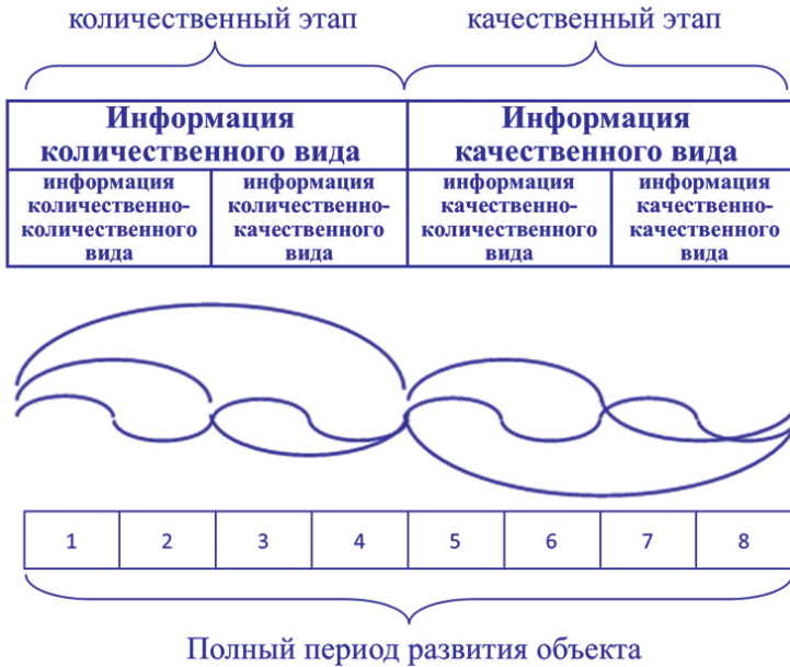
Рис. 2. Модель временной единицы порядка

Однако процесс развития во времени определяется продолжительностью. Поэтому развитие биогеоценоза имеет объективные временные, или темпоральные, закономерности. В соответствии с информационной моделью временные периоды имеют такую же структуру (рис. 2), где каж-