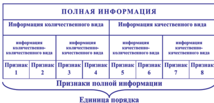
Рис. 1. Трансдисциплинарная модель информационной единицы порядка

подхода требует дифференциации параметров развития системы на количественные и качественные. Подобное деление представляет собой информационный диполь. Деление параметров на количественные и качественные в данном случае имеет строго методологический, технологический (в рамках данной концепции) характер. Совокупное развитие природных, социально-экономических