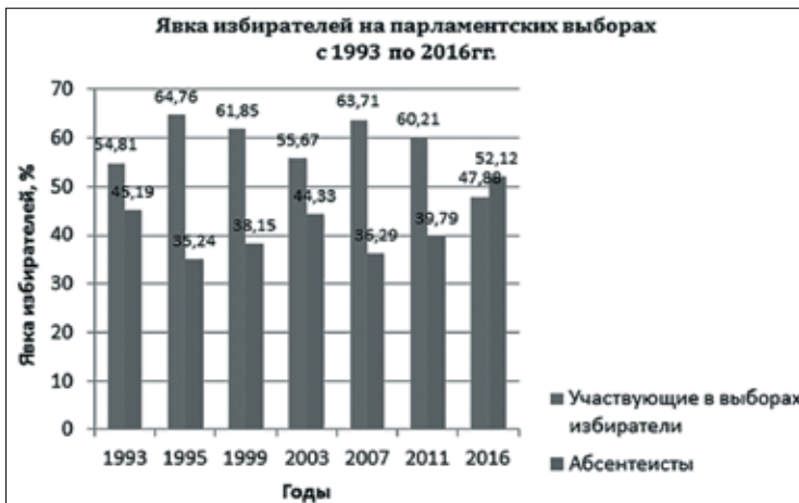
Рис. 1. Явка избирателей на парламентских выборах с 1993 по 2016 г.

Прошедшие в 1995–1996 гг. парламентские и президентские выборы апробировали новые электоральные формулы. Так, в парламентских выборах, прошедших 17 декабря 1995 г., ЦИК РФ зарегистрированы федеральные списки 43 избирательных объединений и блоков. Только четыре из