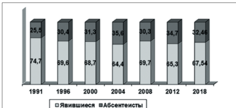
Рис. 2. Динамика явки/неявки избирателей на президентских выборах в период 1991–2018 гг. (%)

Парламентские выборы депутатов Государственной думы четвертого созыва состоялись 7 декабря 2003 г., в результате которых к распределению депутатских мандатов из 23 зарегистрировавшихся федеральные списки кандидатов, участвующих в выборах, получили только четыре политических партии, преодолевшие 5% избиратель-