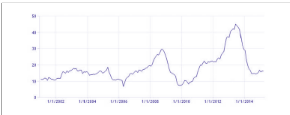
Рис. 1. Динамика инфляции в Иране с 2002 по 2014 г. (по данным Центрального банка ИРИ)

ционный рост усилился (рис. 2). Во многом девальвация валюты в стране связана с закрытостью международного рынка капитала, сокращением валютных резервов Ирана и необходимостью использовать бартерные сделки для получения импортных товаров, что исключает риа́л из реальных внешнеторговых сделок.