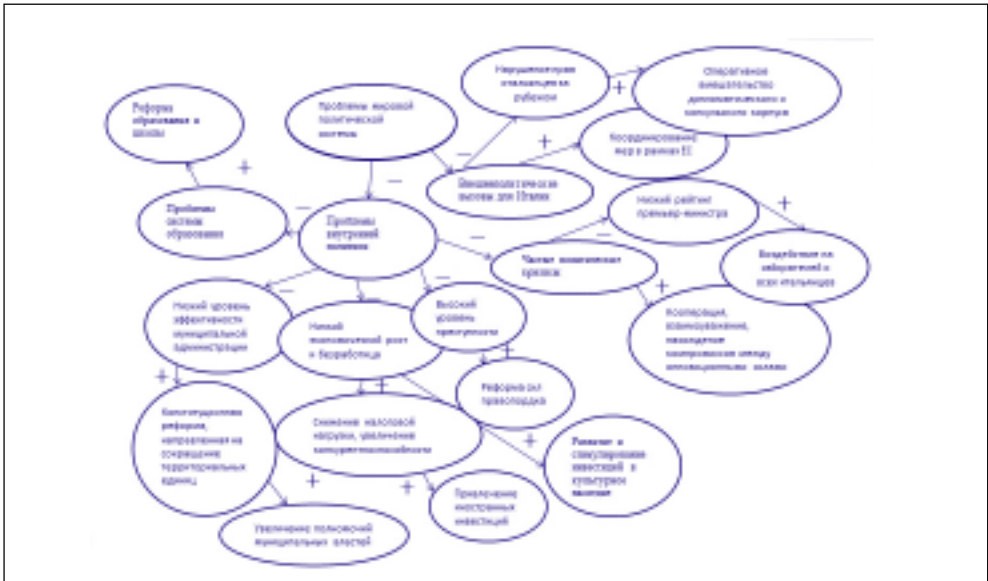
Рис. 1. Итоговая схема связей категорий в когнитивном картировании речи С.Берлускони