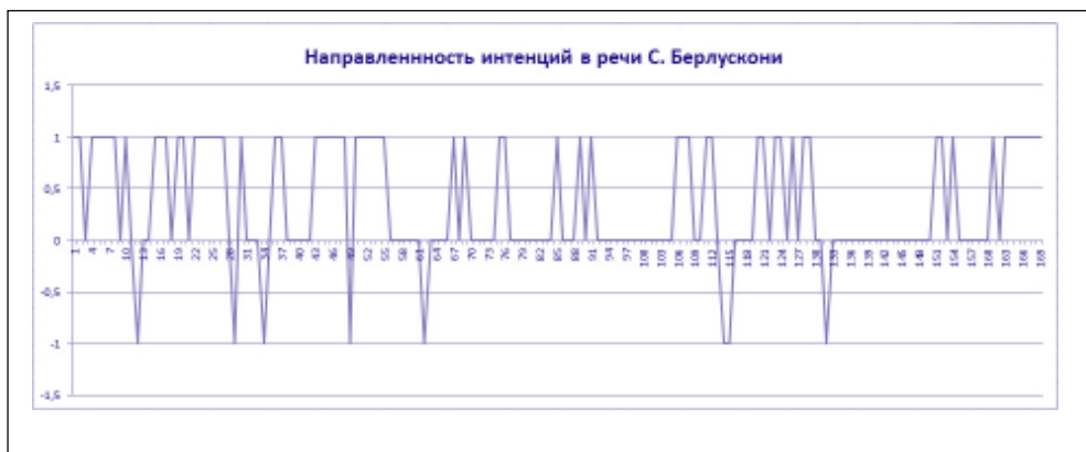
Рис. 4. Направленность интенций в речи С.Берлускони

На рис. 3 показано, что отрицательных тенденций у Ренци гораздо больше, чем у Берлускони (рис. 4), но