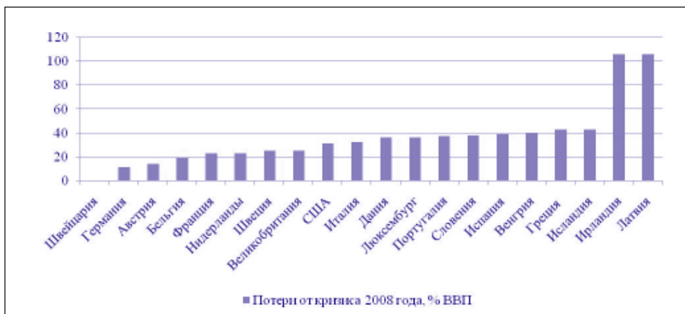
Рис. Финансовые потери от кризиса 2008 г., % ВВП

Примечание: Составлено по данным сайта www.imf.org