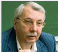
Виталий ТРЕТЬЯКОВ, декан Высшей школы телевидения МГУ

« Сама по себе проблема двух национальностей Украины фактически не признана нынешней украинской элитой, даже элитой с русскими корнями, с русскоязычными традициями и, собственно, с русским языком. Эта проблема остается, потому что, отделившись от России, Украина вынуждена, в данном случае, руководствоваться определенной долей национализма. Это как бумеранг. То есть, с одной стороны, создание национальной элиты, ориентированной на национальные и отчасти даже на националистические тенденции, в данном случае украинские. Это способствует становлению государства как независимого и полноценного его исторического отделения от России. С другой стороны, работа в этом направлении по-прежнему продолжает раскалывать Украину на две части — Юго-Восточную и Западную. Дискуссии на сей счет на Украине по-прежнему ведутся. Намечается некая радикализация, в том смысле, что людям надоело жить в этом промежуточном состоянии. Периодически возникает вопрос, что если украинская правящая элита все-таки снимет проблему Шухевича, Бандеры, других «героев Украины», но содержательно, по существу, не откажется от украинского национализма, не уравнивает всех своих граждан, в первую очередь, по языковым признакам, по этническим, — то раскол