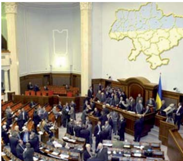
Верховная Рада Украины

Тимошенко точно с такой же категоричностью заявляет, что изменения в Конституцию должны вноситься только в парламенте. В этом споре сразу же выплывает и сопутствующая проблема №2: Виктор Андреевич хотел бы усиления президентских полномочий, а Юлия Владимировна выступает за чисто парламентскую республику с премьером-канцлером во главе ее, где глава государства исполнял бы сугубо номинальную функцию.