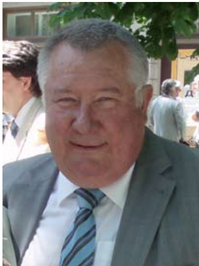
Генерал-майор Владимир РОМАНЕНКО, независимый эксперт

– На сегодняшний день для России южное направление является основным стратегическим. Это же центр всех торговых коммуникаций, как был, так и есть во все века и времена. Мировой центр. Важнейшие торговые пути России тоже здесь находятся. «Голубой поток» в Турцию идет, сейчас