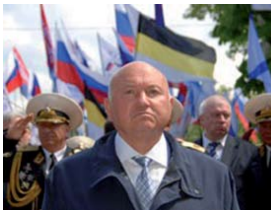
Мэр Москвы Юрий ЛУЖКОВ на праздновании 225-летия Черноморского флота России в Севастополе

Затем из уст Лужкова прозвучала фраза, за которую ныне многие и цепляются: «И мы говорим о том, что этот вопрос остался нерешенным. И мы его будем решать. Мы его будем решать в пользу той правде, тех государственных позиций и того государственного права, которое имеет Россия по