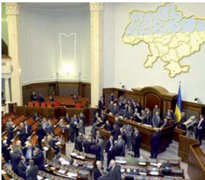
Верховная Рада Украины

Тимошенко точно с такой же категоричностью заявляет, что изменения в Конституцию должны вноситься только в парламенте. В этом споре сразу же выплывает и сопутствующая проблема №2: Виктор Андреевич хотел бы усиления президентских полномочий, а Юлия Владимировна выступает за чисто парламентскую республику с премьером-канцлером во главе ее, где глава государства исполнял бы сугубо номинальную функцию.