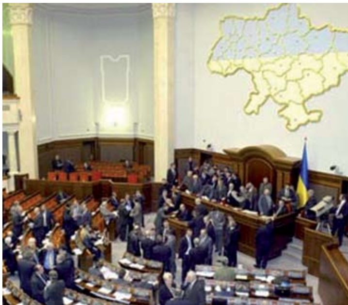
Верховная Рада Украины

Тимошенко точно с такой же категоричностью заявляет, что изменения в Конституцию должны вноситься только в парламенте. В этом споре сразу же выплывает и сопутствующая проблема №2: Виктор Андреевич хотел бы усиления президентских полномочий, а Юлия Владимировна выступает за чисто парламентскую республику с премьером-канцлером во главе ее, где глава государства исполнял бы сугубо номинальную функцию.