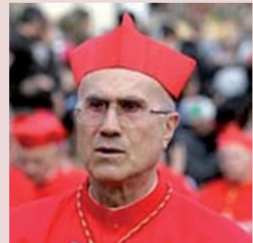
Кардинал Тарчизио БЕРТОНЕ

Кардинал Тарчизио БЕРТОНЕ, Государственный Секретарь, Камерленго Святой Римской Церкви, Архиепископ-эмерит города Генуя (Италия).